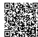
最低賃金特設サイト

●お問合せは 石川労働局労働基準部賃金室(☎076-265-4425) /七尾労働基準監督署(☎0767-52-3294)