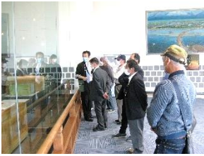
ますのすしの工場見学

梅かまでは、蒲鉾に彩られた精緻な細工を見学するなど富山の産業を知ることで有意義な一日を過ごすことができました。また、予定にはありませんでしたが帰りに今年国宝に指定された勝興寺（高岡市）へ寄り、由緒ある古刹の本堂を見学しました。