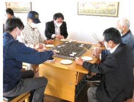
せんべい焼き体験