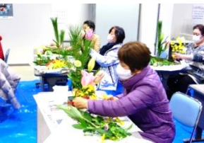
作品を作る女性部員