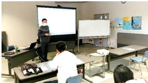
「働き方改革セミナー」の様子

今後とも引き続き働き方改革関連法対応に係る情報提供、支援を実施してまいりますので、お気軽にご相談ください。